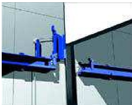
Дверной рельс установлен на стене. Вырез части рельса разрешён

Дверной рельс установлен на стене. Вырез части рельса запрещён.